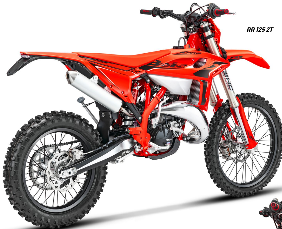
RR 125 2T

Motore 2T 125: RR X-PRO My26 propone un nuovo pistone e una nuova testa motore, modificata nell'architettura della camera di combustione, allo scopo di incrementare coppia e potenza messi in campo dal monocilindrico 125 2T. / Engine 2T 125: The RR X-PRO My26 features a new piston and a new engine head, with updated combustion chamber architecture to increase the torque and power provided by the single-cylinder 125 two-stroke. / Moteur 2T 125: La RR X-PRO MY26 se dote d'un nouveau piston et d'une nouvelle culasse, modifiée dans l'architecture de la chambre de combustion, afin d'accroître le couple et la puissance fournis par le monocylindre 125 2T. / Motor 2T 125: Mit der RR X-PRO My26, die über einen neuen Kolben und einen neuen Zylinderkopf verfügt, bei dem das Layout der Brennkammer modifiziert wurde, war es das Ziel, das Drehmoment und die Leistung des 2T-Einzylinders mit 125 cm 3 zu erhöhen. (Models affected: RR 2T 125)