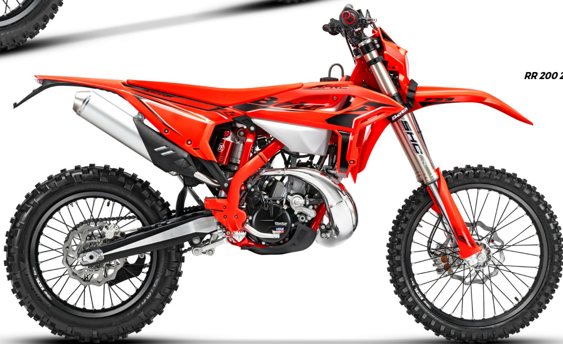
RR 200 2T

Motore 2T 125: RR X-PRO My26 propone un nuovo pistone e una nuova testa motore, modificata nell'architettura della camera di combustione, allo scopo di incrementare coppia e potenza messi in campo dal monocilindrico 125 2T. / Engine 2T 125: The RR X-PRO My26 features a new piston and a new engine head, with updated combustion chamber architecture to increase the torque and power provided by the single-cylinder 125 two-stroke. / Moteur 2T 125: La RR X-PRO MY26 se dote d'un nouveau piston et d'une nouvelle culasse, modifiée dans l'architecture de la chambre de combustion, afin d'accroître le couple et la puissance fournis par le monocylindre 125 2T. / Motor 2T 125: Mit der RR X-PRO My26, die über einen neuen Kolben und einen neuen Zylinderkopf verfügt, bei dem das Layout der Brennkammer modifiziert wurde, war es das Ziel, das Drehmoment und die Leistung des 2T-Einzylinders mit 125 cm 3 zu erhöhen. (Models affected: RR 2T 125)