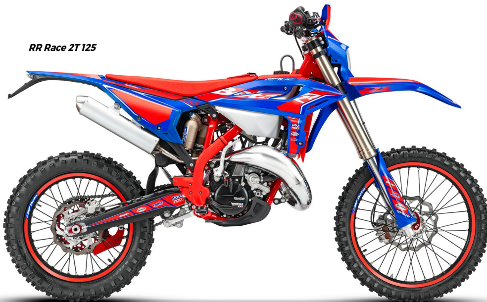
RR Race 2T 125

RR 125 2T: Per supportare le prestazioni del brillante motore 2T 125cc e la necessità di cambiate rapide e precise, è stato introdotto un cambio totalmente nuovo, con ingranaggi rinforzati, robusto e ottimamente calibrato. / RR 125 2T: To support the brilliant performance and the need for quick and accurate gear changes, a new gear system has been introduced, with reinforced gears. / RR 125 2T: Pour soutenir les brillantes performances du moteur 125 cm 3 et la nécessité de passages de vitesses plus rapides et précis, une toute nouvelle boîte de vitesses avec une pignonerie renforcée a fait son apparition. / RR 125 2T: Um die brillante Leistung des 125er-Modells und die Notwendigkeit schneller und präzisen Gangwechslern zu unterstützen, wurde ein vollkommen neues Getriebe mit verstärkten, robusten und hervorragend kalibrierten Zahnradern entwickelt. (Models affected: RR 2T 125 - RR 2T 200)