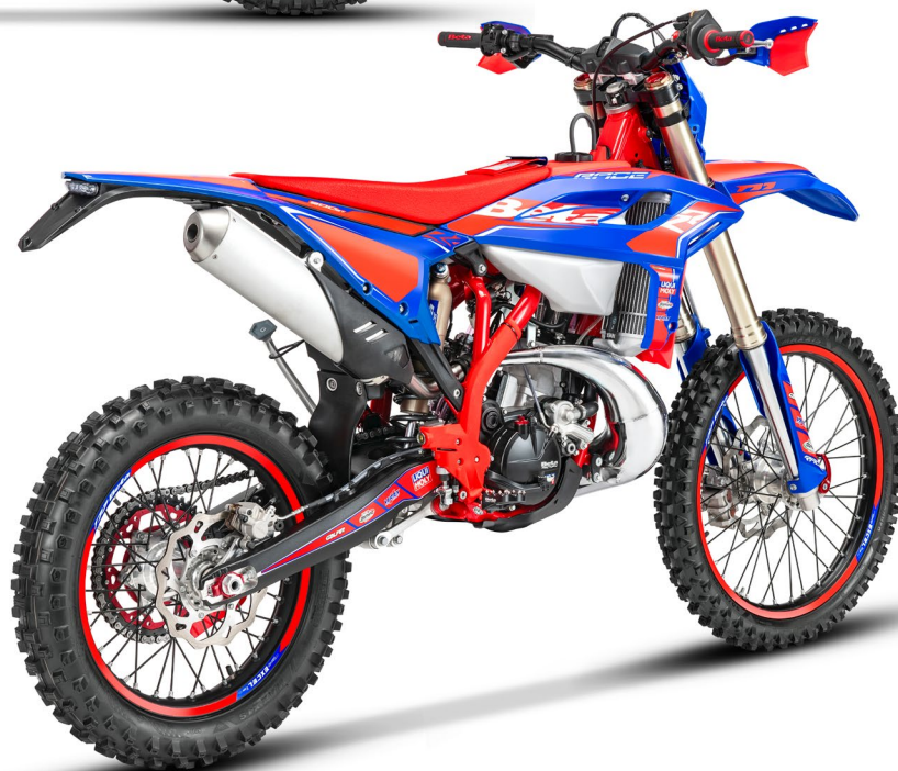
RR RACE 2T 200

RR 200 2T: ottiene un ulteriore aggiornamento al cambio, grazie a un intervento sia sulla trasmissione primaria che su quella secondaria. /